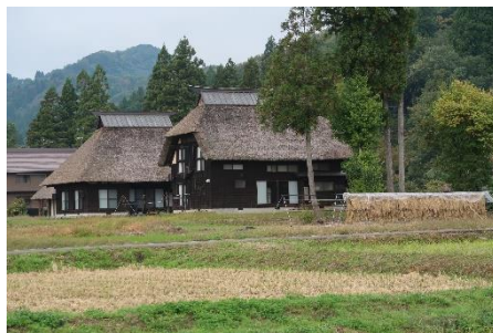
↑荻野集落です。体験型宿泊施設やカフェに改装したかやぶき屋根の家などを見せていただきました。

大地の芸術祭では廃校を活用した「森と木の実の美術館」を見学しました。「学校はカラッポにならない」と題した空間絵本の世界を楽しみました。懐かしい学校の雰囲気も子供の頃に帰った気持ちになりました。