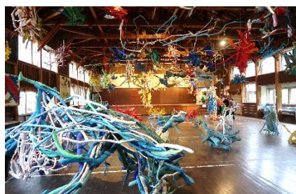
↑大地の芸術祭です。廃校活用の一例を見学することができました。