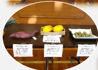
抽選会と巨大・珍形農産物展の様子です