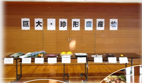
巨大・珍形農産物展