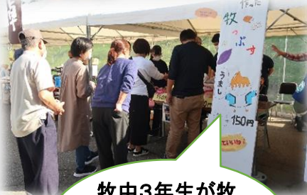
牧中3年生が牧区の実りで作った「牧っぷす」も大人気でした。