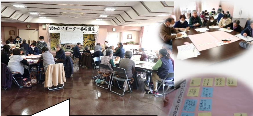
グループワークで話し合い中です。

12月8日(金)牧コミュニティプラザで認知症サポーター養成講座を開催しました。今回は、「認知症は怖い病気ではない！」をテーマにグループワークを通して話し合い、考えを深めました。(福祉部会・よろばたの会)