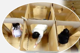
※一部画像を修正しています