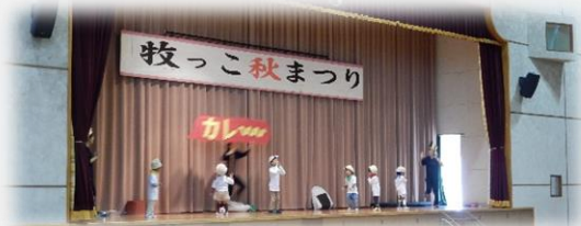
ステージ発表の様子です

11月3日に行われた牧っこ秋まつり。当日は晴天に恵まれ、多くの皆様にお越しいただきました。秋まつりにお越しいただきました皆様、ありがとうございました。また、まつりにご協力いただきました皆様に心より感謝申し上げます。 (地域振興部会)