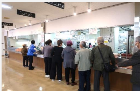
↑上越教育大学構内の見学と学食をいただきました。